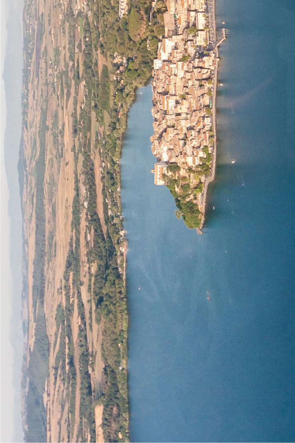
Anguillara dall'alto dei Cieli, sperando ci pensino Loro.